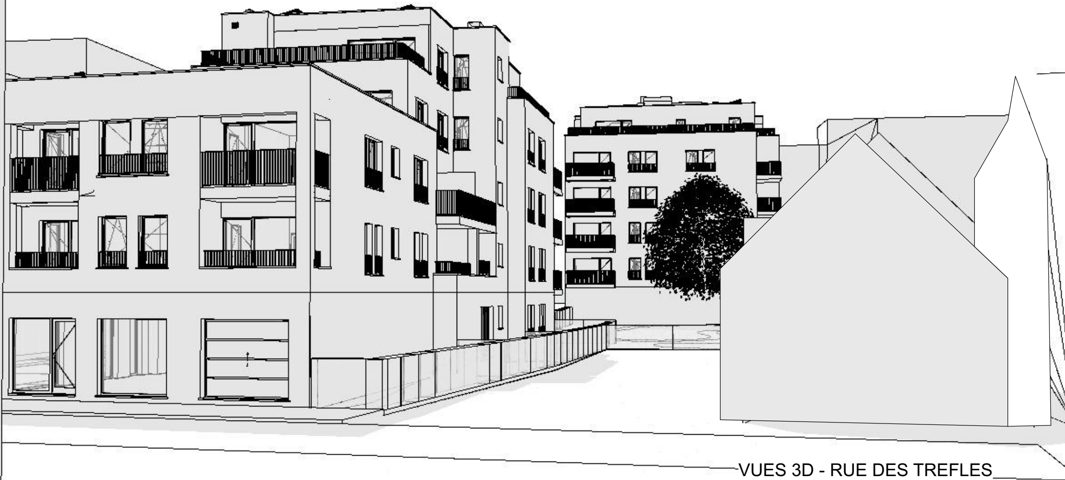
VUES 3D - RUE DES TREFLES