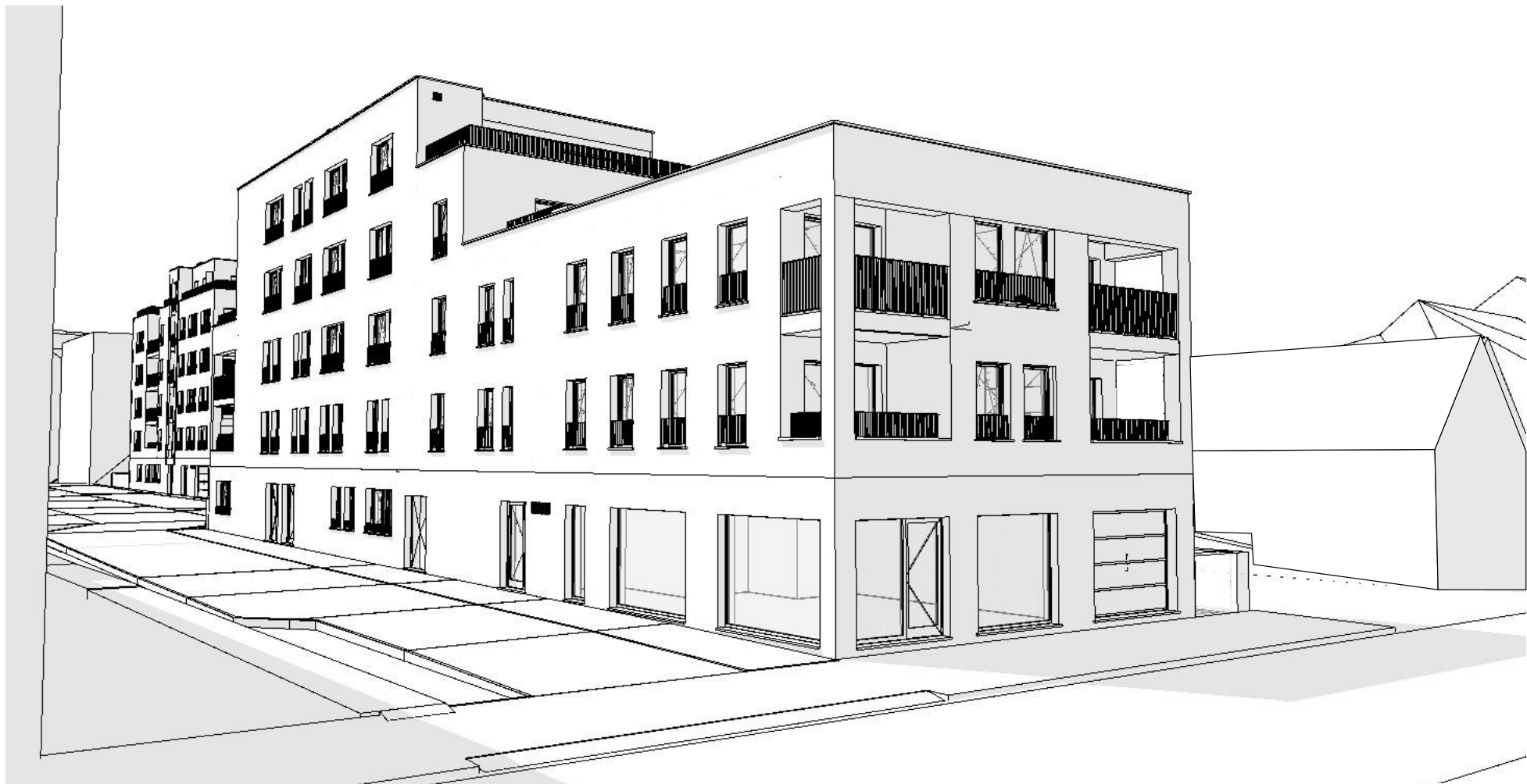
VUES 3D - RUE DES TREFLES